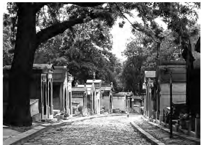
Figura 6. El parisino Cimetière du Père Lachaise, establecido en 1804, hoy en día es una referencia turística obligada. Se concibió como una estructura urbana funcional que combinaba el concepto del jardín inglés y el de centro de recogimiento, a la par que invitaba al “paseo”. La imagen muestra el llamado Chemin Errazu.

“La necesidad de encontrar los límites de lo que se podía conocer [...] brotaba de experiencias relacionadas con la debilidad del carácter, que nos