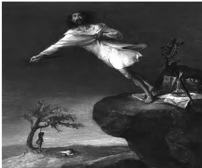
Figura 10. Sátira del suicidio romántico (1839), óleo sobre lienzo de Leonardo Alenza y Nieto (1807-1945), una de las obras simbólicas más señeras del Romanticismo en el arte español y adquirida por Enrique Aguilera y Gamboa (1845-1922), marqués de Cerralbo (Museo del Romanticismo, Madrid, España).

El advenimiento de la tecnología fotográfica en realidad vino a establecer un canal muy conveniente para fijar en el tiempo justamente aquello que era una actitud muy de su época. Por esto, la fotografía post mortem , toda vez que el invento ganó popularidad como reemplazo asumible de las manifestaciones figurativas precedentes, solo accesibles a personalidades de alto rango o especial fama, como la pintura de difuntos o las máscaras mortuorias, permitió ir más allá del tradicional camafeo, o del mechón de cabello