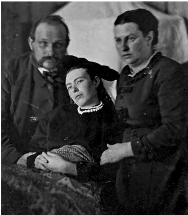
Figura 13. Fotografía familiar británica en la que los padres posan junto con su hija fallecida. Obsérvese que el rostro de la difunta, al no moverse durante la exposición, aparece mucho más definido. La fecha y procedencia de la imagen se encuentra en discusión.

En suma, y en tanto que forma de expresión en sí misma, la fotografía establece códigos simbólicos que han de desve-