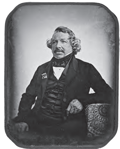
Figura 2. Louis-Jacques Mandé Daguerre en retrato al daguerrotipo realizado por Jean-Baptiste Sabatier-Blot (1801-1881), en 1844 (George Eastman Museum, Rochester, Nueva York, EE.UU.).