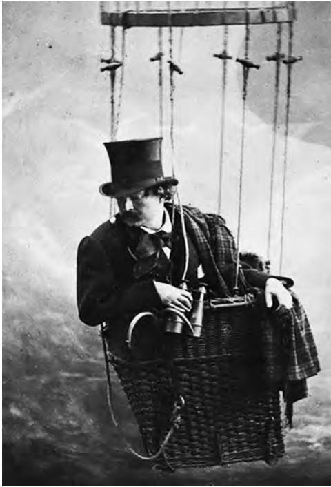
Figura 16. Autorretrato de estudio, de fecha desconocida, del maestro de la fotografía del siglo XIX, Nadar, simulando viajar en la cesta de un globo aerostático.

luces y sombras, destinados a inducir en el espectador la idea de que el difunto “posaba” en función de la convención del momento. Se eludía de este modo la idea de que el muerto estaba definitivamente muerto, alimentando consoladoramente la negación del doliente y suscitando la idea de la permanencia, del “estar” (Henao Albarracín, 2013).