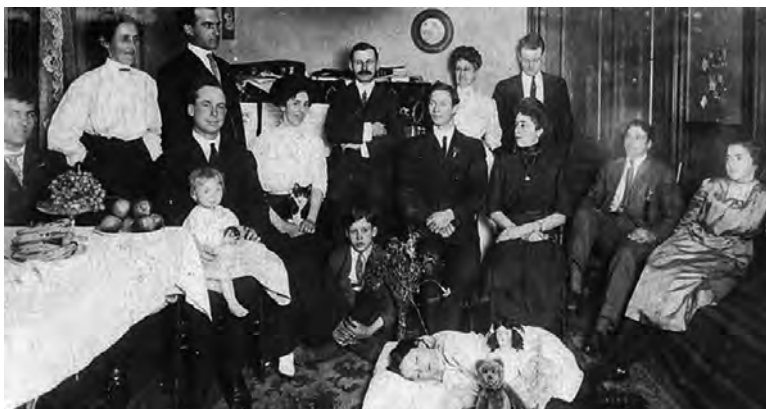
Figura 15. Abigarrada composición de grupo cuasi pictórica, en la que el cuerpo de la niña finada, en el centro y abajo, domina la escena, estableciendo el motivo de la fotografía. Tras él, incorporados al recuerdo y como velando su sueño, posan con sus mejores galas los deudos principales de la fallecida, ofreciendo la impresión general de una nutrida reunión familiar.

Por principio, la fotografía post mortem contaba con un modelo ideal –en tanto que perfectamente quieto– para fijar tiempos de exposición, ángulos de enfoque e iluminaciones, de suerte que permitió a muchos especialistas desplegar sus dotes técnicas e incluso mejorar sus aptitudes de cara al retrato de personas vivas. El fotógrafo, idealmente, trataba de favorecer al difunto minimizando el efecto de los fenómenos cadavéricos, lo cual no siempre resultaba una tarea sencilla o agradable (Henoa Albarracín, 2013). No solo porque a menudo se debían contener situaciones biológicas complejas, tales como presencia de fluidos, livideces, giros de los globos oculares o daños corporales severos, sino también porque se trataba de un profesional que ejercía su trabajo en un momento harto complejo para los familiares, siempre presentes, lógicamente preocupados por el tratamiento que se daba al cuerpo del finado, así como por la honorabilidad