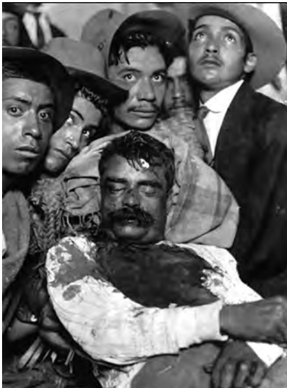
Figura 18. Conocida fotografía, de autor desconocido, del cadáver del líder revolucionario Emiliano Zapata (1879-1919), exhibido en Cuautla, Morelos (México), 10 de abril de 1919.