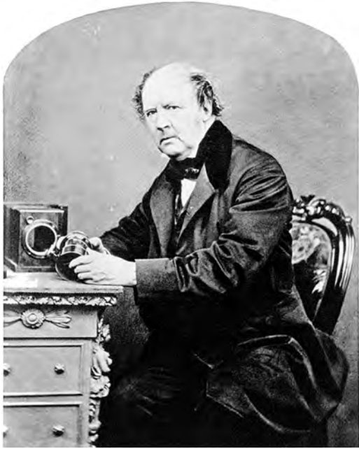
Figura 3. William Henry Fox Talbot en un calotipo realizado por el escocés John Moffat (1819-1894), en mayo de 1864.

la tecnología fotográfica de un espectro social más amplio (figura 3). 2