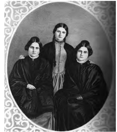
Figura 8. De izquierda a derecha, Leah, Kate y Margaret Fox, las célebres hermanas estadounidenses cuyo relato, que reconocerían como falso en 1888, desató la fiebre del espiritismo en medio mundo (fuente desconocida).