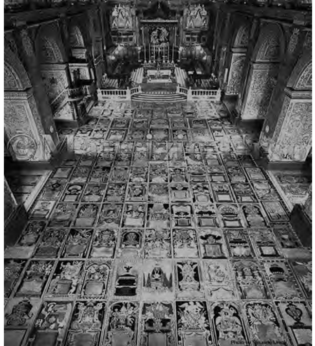
Figura 5. Suelo de la Concatedral de San Juan en Malta, con 400 enterramientos de caballeros y oficiales de la Orden de San Juan de Jerusalén, cuyas lápidas cubren absolutamente todo el piso del templo. La primera tumba data del 1606 y los cuerpos continuaron siendo enterrados en la catedral hasta el siglo XIX.

riario, que durante siglos no devino en preocupación, empezó a percibirse como un problema a finales del siglo XVIII (Carrero Santamaría, 2006; Fischer, 2019). Es más, fue solo con la creencia de que la descomposición de los cadáveres, infectados por la plaga de turno o no, podía desprender infinidad de “vapores mefíticos” y “miasmas”, que comenzó a