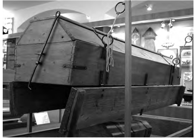
Figura 4. Ataúd josefiniano (Bestattungsmuseum, Viena, Austria). El artefacto, toda vez que concluían las exequias, como puede apreciarse, contaba con un fondo que se abría al accionar el mecanismo. De tal modo, el cuerpo caía a la tumba y el ataúd se retiraba para emplearse en otro servicio funerario.

Una de las consecuencias inmediatas de estos hechos fue que el concepto de “salud pública” asociado al ritual fune-