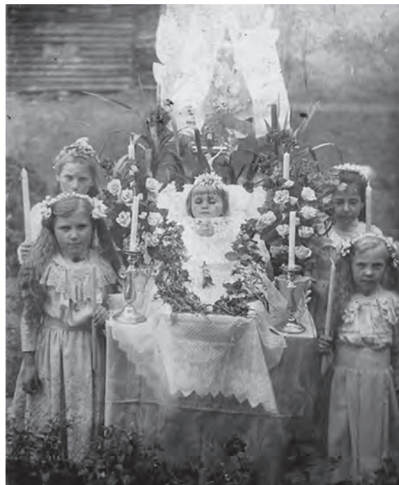
Figura 12. Detalle de una postal-recordatorio de “angelitos”, realizada en fecha indeterminada entre 1890 y 1920 (Lichet, 2021).

habitual en todas partes sino hasta la década de 1880 (Gueerra, 2010), pues solo entonces comenzó a considerarse que el niño fuera una “persona” en sentido completo y que, por consiguiente, hiciera falta recordarlo de una manera tan especial en el contexto de la vida familiar como al adulto. Es más, contra la lógica inherente al duelo, la muerte del niño era considerada en muchos lugares motivo apto para el gozo y la celebración, pues era según el sentir popular un “angelito” reclamado —elegido— por el cielo (figura 12). En efecto, las exequias infantiles mostraban importantes diferencias con las de los adultos en la tradición eclesiástica ya desde el siglo XVII. En el Rituale Romanum de Pablo V —Camillo Borghese— (1552-1621), promulgado en 1614, se establecía que los niños menores de siete años eran inocentes a todos los efectos —párvulos—, entretanto las exequias de los mayores de esa edad debían ser las propias del adulto, salvo que pudiera demostrarse que eran realmente “inocentes” y carentes por ello de pecado. Todo esto implicaba que la simbología propia del luto fuera disimulada en el caso de la infancia y que, en muchos lugares, tales exequias tuvieran incluso cierto toque festivo, con convite incluido para los asistentes (Chaparro Contreras, 2017).