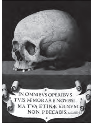
Figura 1. Calavera (o Memento mori ), obra del artista valenciano Juan de Juanes (1505-1579). La leyenda se podría traducir como: “En todas tus acciones acuérdate del final y no pecarás jamás” (Museu Belles Arts, València, España).

El memento mori –o “recuerda que morirás”– fue muy importante en el contexto de las disciplinas ascéticas como un medio para el perfeccionamiento del carácter por la vía del desapego a lo material, dirigiendo la atención hacia la inmortalidad del alma y hacia el más allá. Se trata de un canal expresivo que trasciende del arte, pues esta representación no