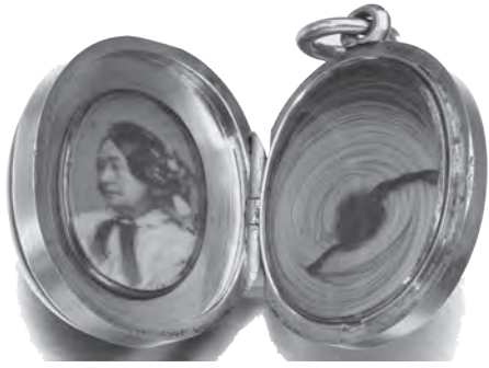
Figura 11. Ejemplo de las denominadas “joyas de luto”: colgante de ágata y diamantes con fotografía y mechones de cabello encargado por el príncipe consorte Alberto de Sajonia-Coburgo y Gotha (1819-1961) para su esposa, la reina Victoria del Reino Unido (1819-1901), para recordar la muerte de su madre, Victoria María Luisa de Sajonia-Coburgo-Saalfeld (1786-1861), duquesa viuda de Kent, fallecida en 1861. Propiedad de Patricia Knatchbull (1924-2017), segunda condesa Mountbatten.

—incluso diente o trozo de hueso— albergado en un relicario de mayor o menor lustre, para conservar una pertenencia o imagen física, detenida en el tiempo, del finado que, acaso, fuera el único recuerdo existente de la persona fallecida (figura 11). Esto resultaba especialmente cierto en el caso de los niños, colectivo con el que las altas tasas de mortalidad se cebaban de manera especialmente significativa. No obstante, esta última idea debe ser adecuadamente puntualizada.